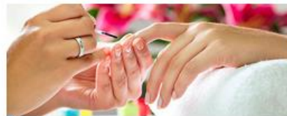
Оказание косметических услуг на дому