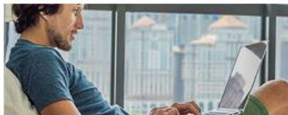
Удаленная работа через электронные площадки

НПД можно платить и при осуществлении других видов деятельности, если соблюдаются все условия, предусмотренные Федеральным законом от 27.11.2018 № 422-ФЗ.