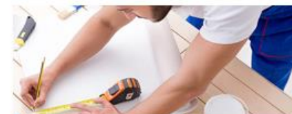
Строительные работы и ремонт помещений