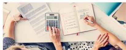
Юридические консультации и ведение бухгалтерского учета