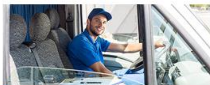
Услуги по перевозке пассажиров и грузов