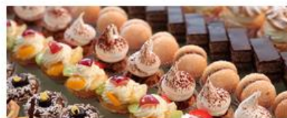
Продажа продукции собственного производства