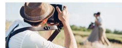
Фото- и видео съёмка