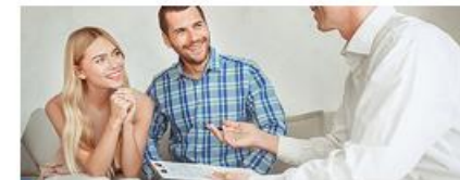
Сдача квартиры в аренду посуточно или на долгий срок