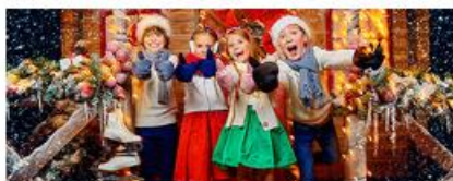
Проведение мероприятий и праздников