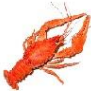
Рак мелкий 5 руб. шт.