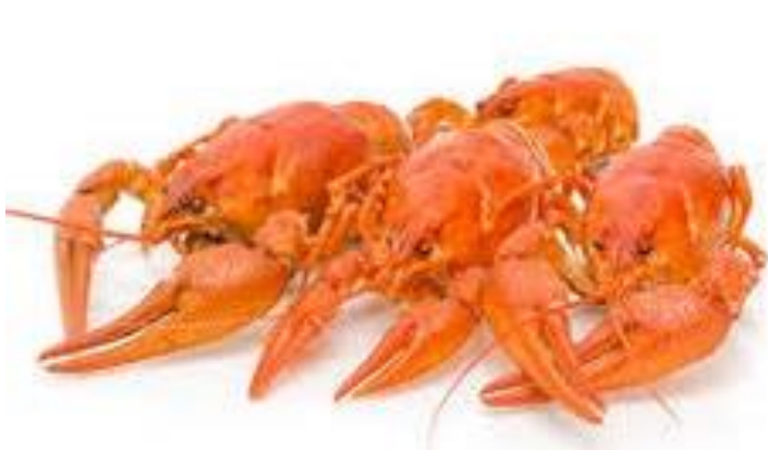
Раки крупные 3000 руб. за 1000 шт.

Снижение расходов или повышение доходов однотипных хозяйств за счёт: